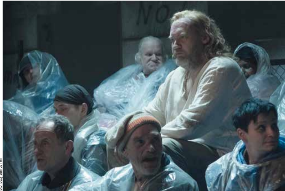
Scène uit de film The Disciples , waarin daklozenkoor De Straatklinders meespeelt.

Verschillende leden van het koor spelen mee in