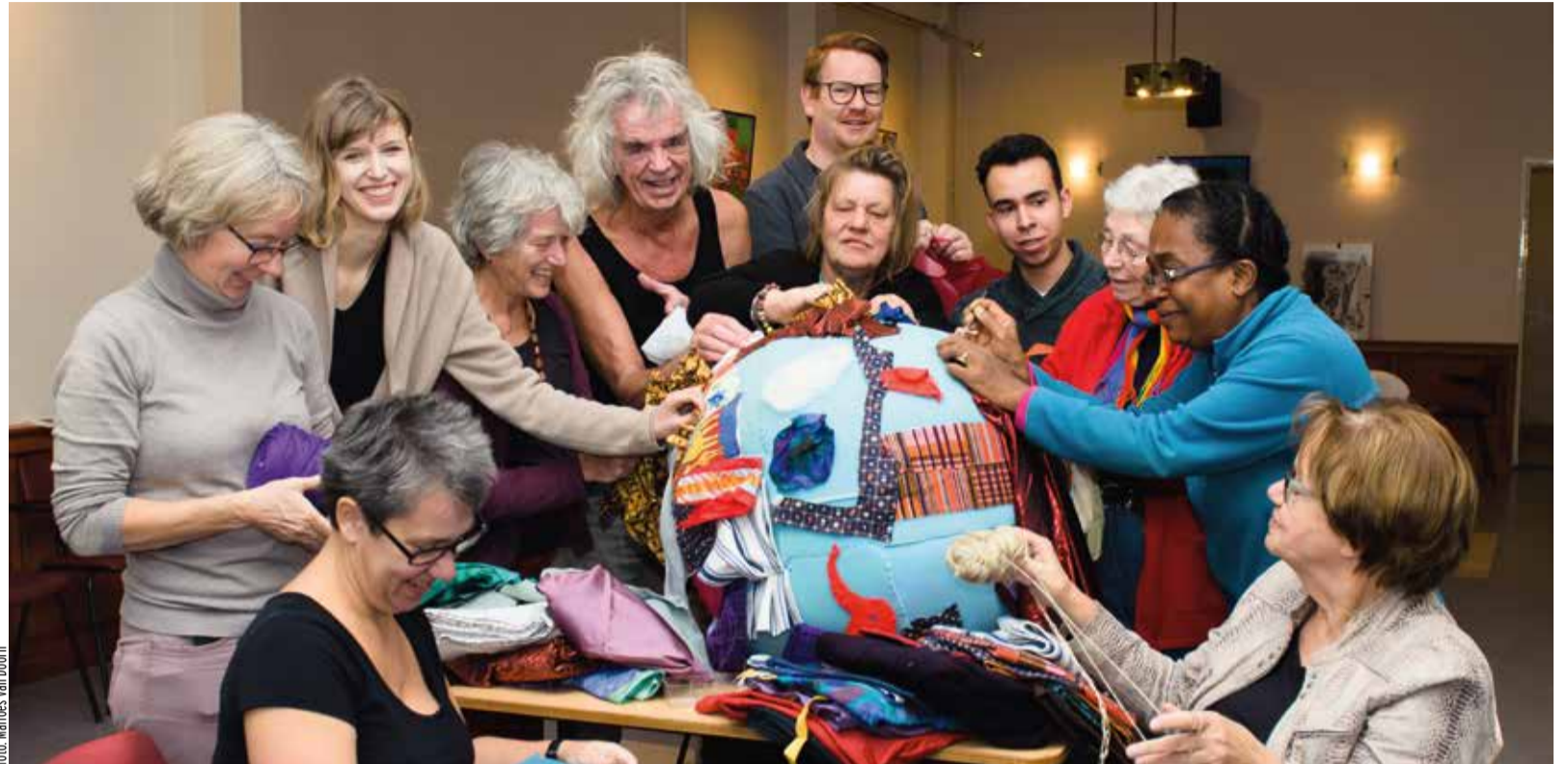
Makers van de eigentijdse kerststal in de Keizersgrachtkerk.