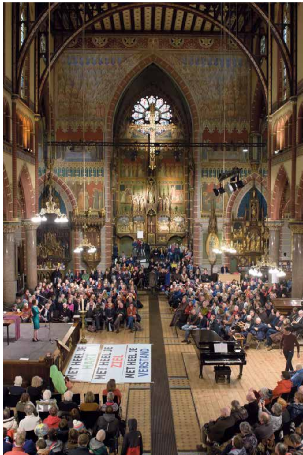
De oecumenische Dominicuskerk - een van de zes Groene Kerken in Amsterdam - was verzamelpunt van de Klimaatmars.

Maar dat is niet het enige, aldus Kroon: 'In de Dominicuskrant staat bijna elke maand een artikel over duurzaamheid. We zamelen oude mobieltjes en lege cartridges in en een groepje van vijf Do-