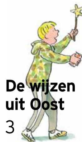
De wijzen uit Oost