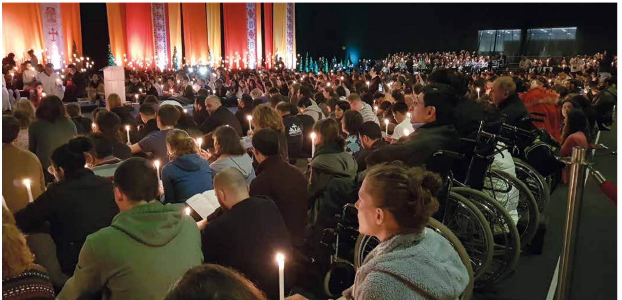
Tijdens de grote Taizé-bijeenkomst in Beiroet met 1.600 mensen uit 45 landen, in verschillende talen samen bidden en zingen: dat is Pinksteren!

Jongerenconferentie Taizé in Beiroet: bezinning en ontmoeting