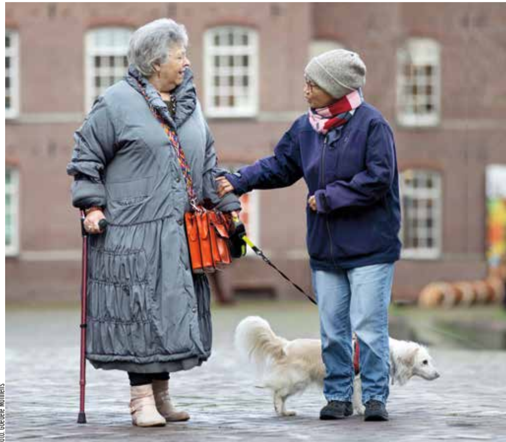
Twee bezoekers van het Huis van de Tijd in Amsterdam.

Zij vervolgt: 'De professionals helpen om de activiteiten mogelijk te maken en bezoekers kunnen daarbij aanhaken. Zo is er op maandag de kunst-