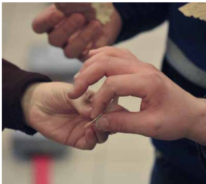
Brood delen tijdens de jongerenconferentie Taizé in Beiroet.