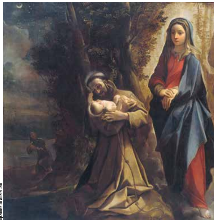
Caracci, Het visioen van de heilige Franciscus van Assisi (1583-1585).

De schilder benadrukt het intens spirituele karakter van het visioen door het grote contrast tussen het hemelse licht van de zon rond Maria en het maanlicht in het nachtelijke duister.