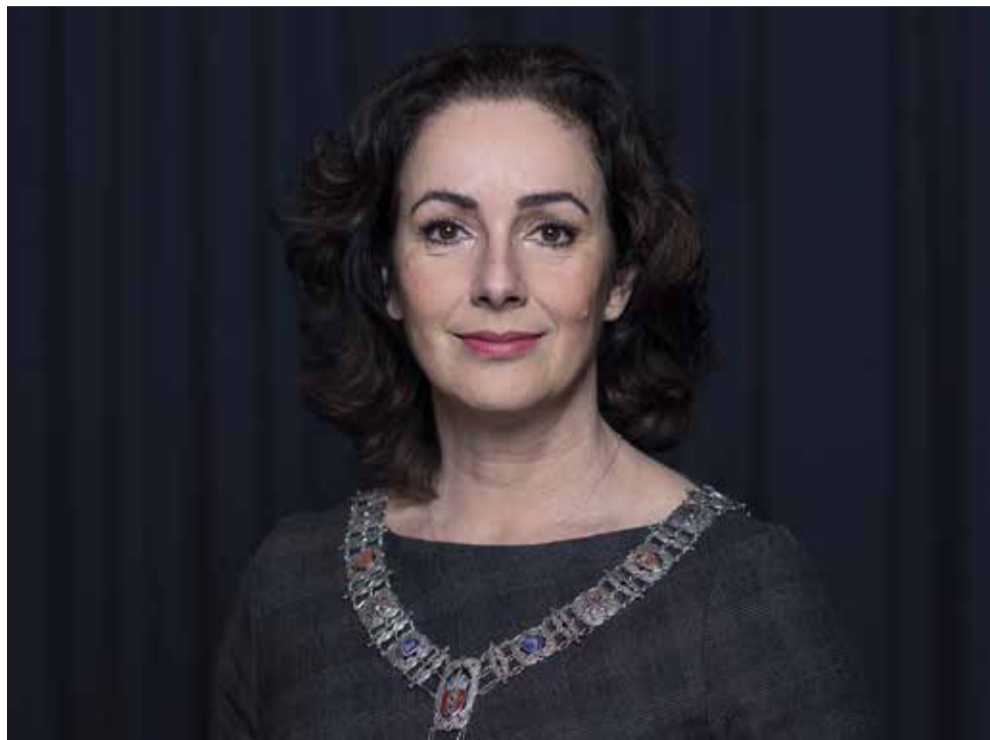
Burgemeester Femke Halsema verzorgt op zondag 10 november de Preek van de Leek in de Singelkerk.