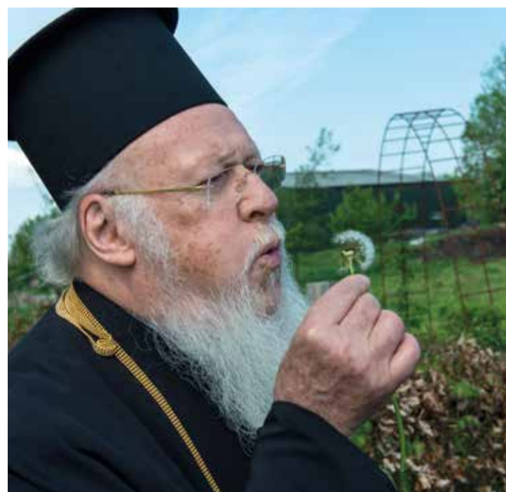
De 'groene' Patriarch Bartholomeüs, spiritueel leider van 300 miljoen orthodoxe christenen, spreekt op het symposium 'Water in Times of Climate Change'.

Adressen kerken: zie protestantsamsterdam.nl/kerken en Dankdag voor Gewas en Arbeid op woensdag 6 november: zie protestantsamsterdam.nl