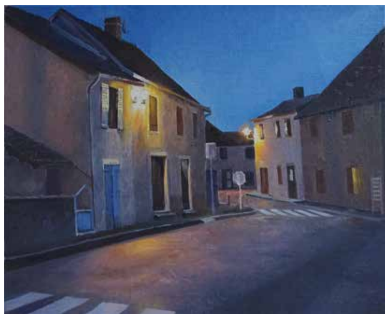
Schilderij van Mark van Praagh: 'Schemering in Vauban', olieverf 2020.