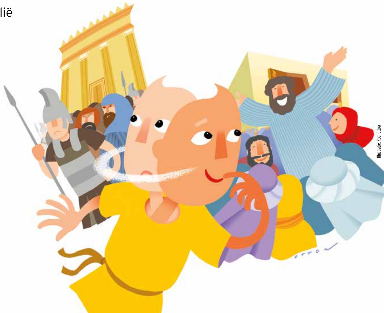
Illustratie: Roel Ottow