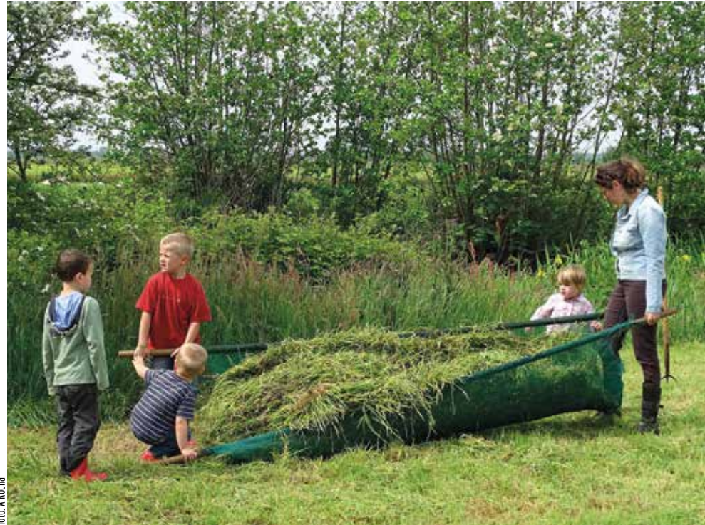
Een van de activiteiten van A Rocha: hooien met kinderen.