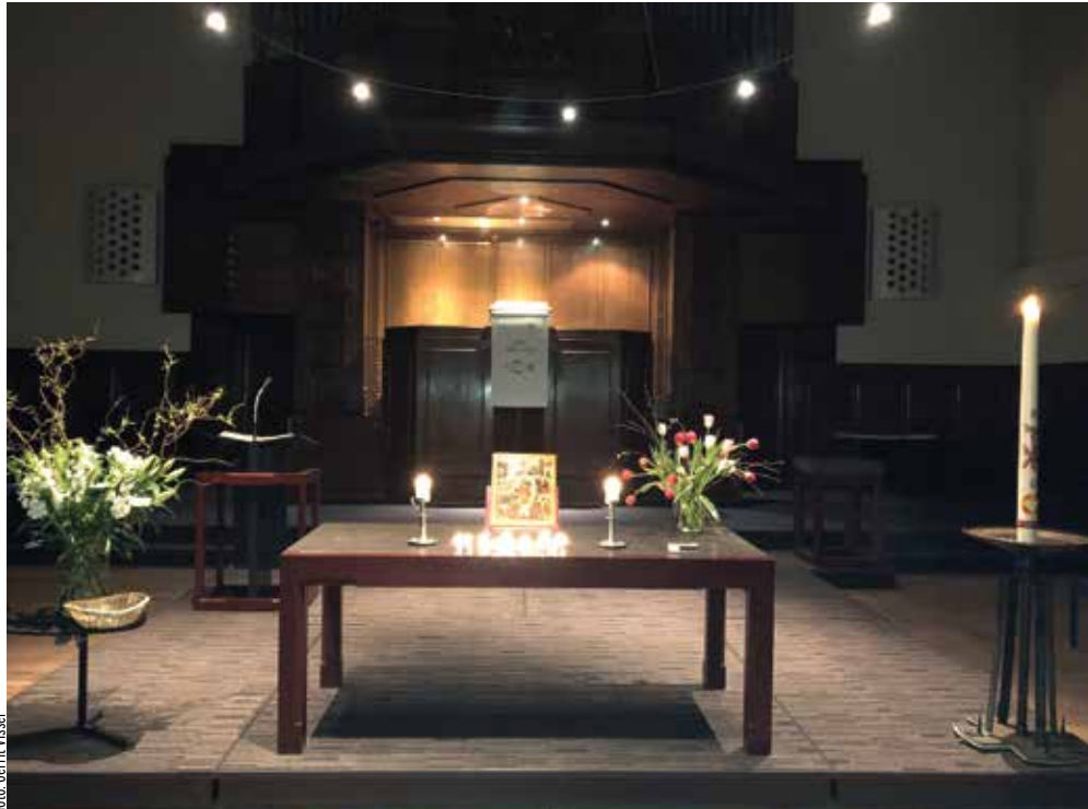
Stilleven op paaszondagavond in de Willem de Zwijgerkerk.