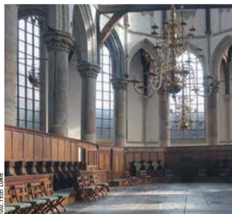
In de Oude Kerk wordt iedere zondagavond een vesper gehouden.

In coronatijd zijn de vespers alleen online mee te