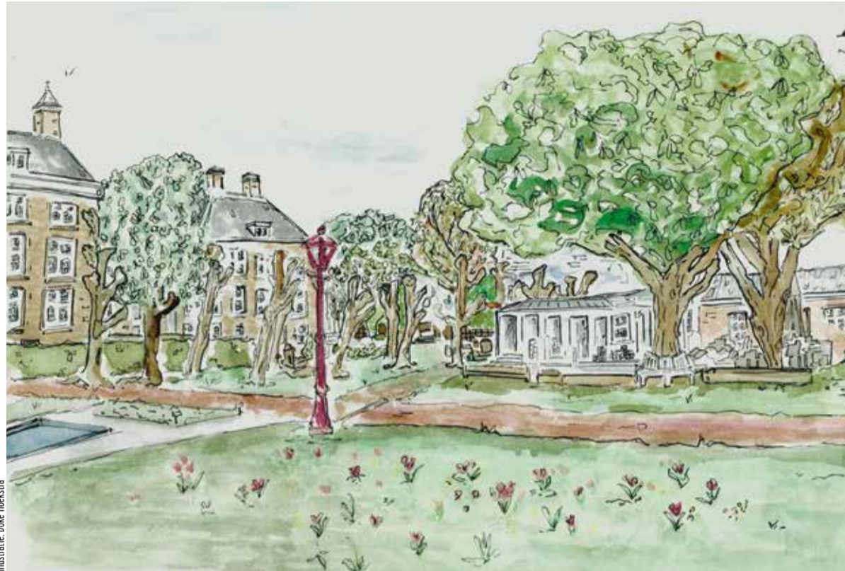
Illustratie: Doke Hoekstra

Holy Hub zoekt nieuwe wegen om over 'heiligheid' te spreken. Wat volgens het woordenboek voor Bijbellezers in de