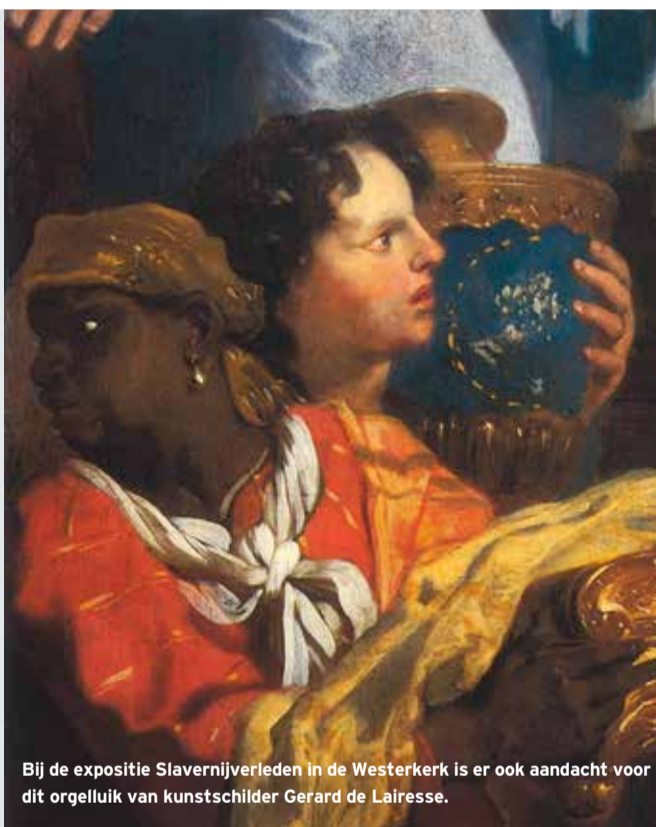
Bij de expositie Slavernijverleden in de Westerkerk is er ook aandacht voor dit orgelluik van kunstschilder Gerard de Laresse.

Voor de overige activiteiten in het kader van de expositie en meer informatie zie: westerkerk.nl.