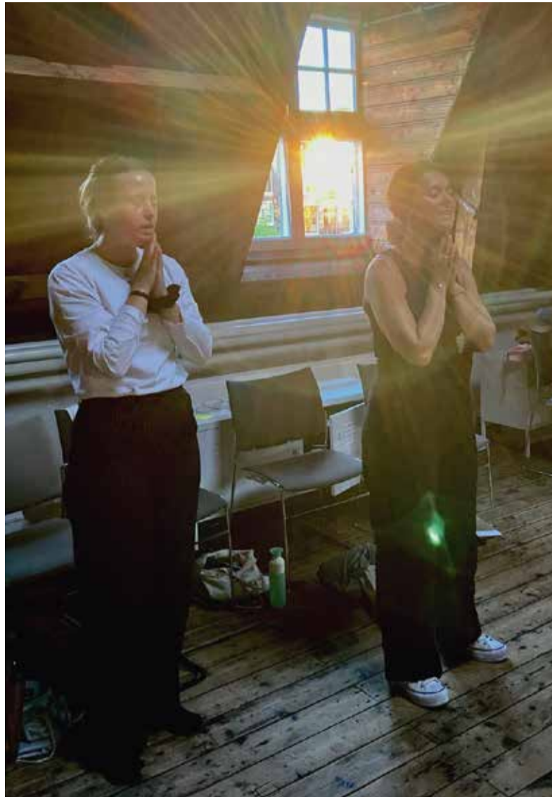
Op de zolder van de Van Limmikhof start een nieuw seizoen van we*Worship, zie onder donderdag 29 september.

De eeuwen door heeft de hoop op vrede in tijden van oorlog mensen geïnspireerd om goede woorden te spreken en tegen de klippen op te zingen. De oorlog in Oekraïne maakt dit voor ons hier en nu eens te meer actueel. Op de Internationale Dag van de Vrede, 21 september, houdt de Westerkerk in samenwerking met de Pro-