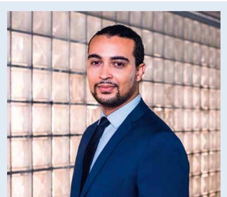
Don Ceder (1989) houdt een overdenking in Vrijburg. Hij is lid van de Tweede Kamer namens de ChristenUnie. Zie onder zondag 18 september.

VOOR ADRESSEN VAN KERKEN EN MEER AGENDA-ACTIVITEITEN ZIE PROTESTANTSAMSTERDAM.NL