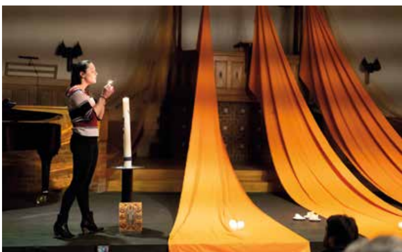
In de Nassaukerk en De Ark (Slotervaart) vinden Taizévieringen plaats, zie onder donderdag 3 november en woensdag 9 november

VOOR ADRESSEN VAN KERKEN EN MEER AGENDA-ACTIVITEITEN ZIE PROTESTANTSAMSTERDAM.NL