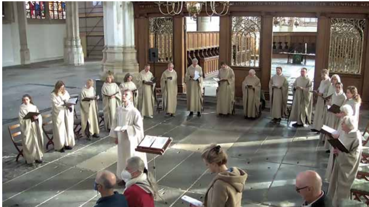
Op zondag 27 november vindt erin de Oude Kerk om 18.30 uur een Choral Evensong plaats met medewerking van de Cappella Oude Kerk. Een Evensong is een kerkdienst die traditioneel rond zonsondergang wordt gehouden en gericht is op het zingen van psalmen en andere Bijbelse liederen.

Lunchconcerten in De Thomas: klassieke muziek