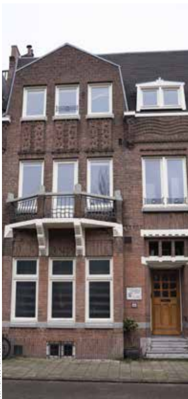
Evangelisch Lutherse Kerk Amsterdam

Van oorsprong is dit een migrantenkerk. Aan de basis, in de 16e eeuw, stonden Duitse kooplieden. Later sloten zich geloofsvluchtelingen uit Antwerpen en Lutheranen uit Scandinavië aan. Net als de rooms-katholieke en andere kerken kreeg ze door het calvinistisch stadsbestuur niet veel ruimte. Het is aan de Lutherse koning van Denemarken te