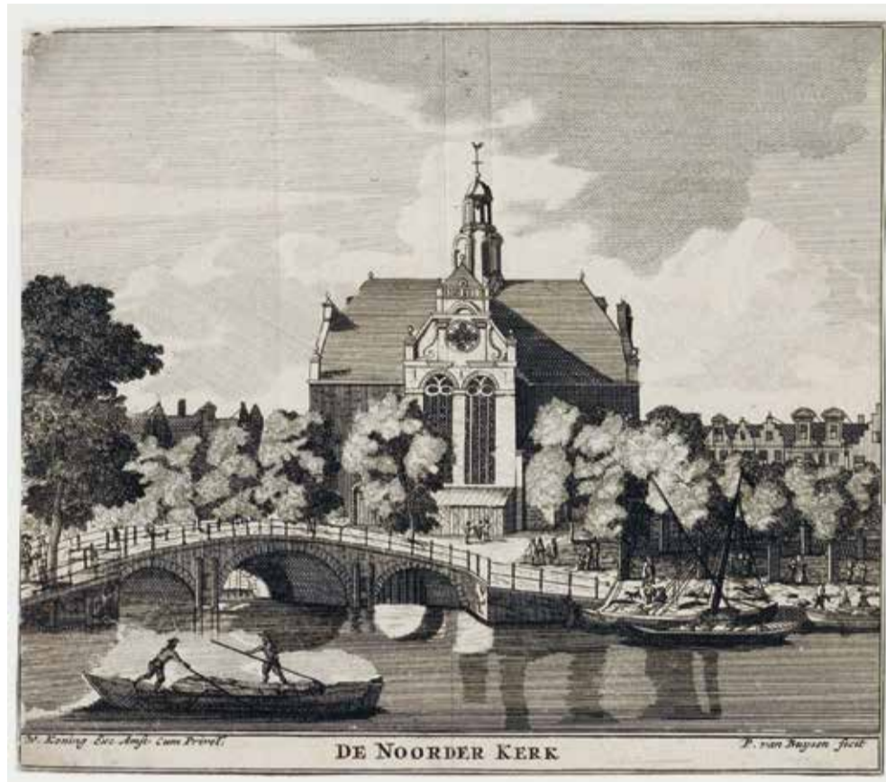
Een oude prent van de Noorderkerk.

Architect Hendrick de Keyser ontwierp de Westerkerk voor de bewoners van de grachtengordel en de Noorderkerk voor het volk van Het Nieuwe Werck. Voor het eerst in de Amsterdamse geschiedenis kregen deze kerken een protestantse vorm